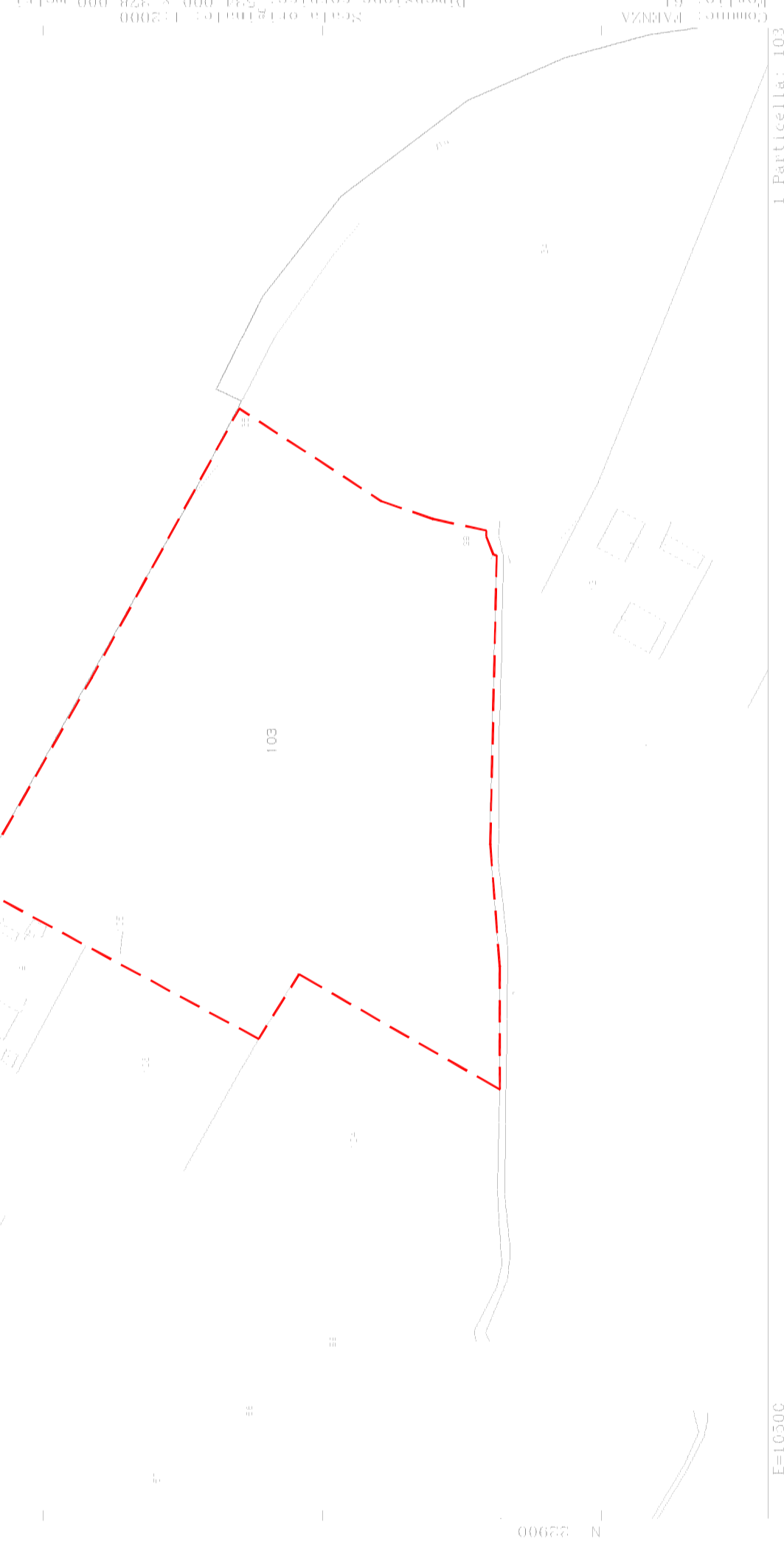
Estratto Mappa Catastale scala 1:2000

Perimetro Area Intervento Foglio 61, Mappali 35-36-103-105 Superficie catastale mq. 28.200,00